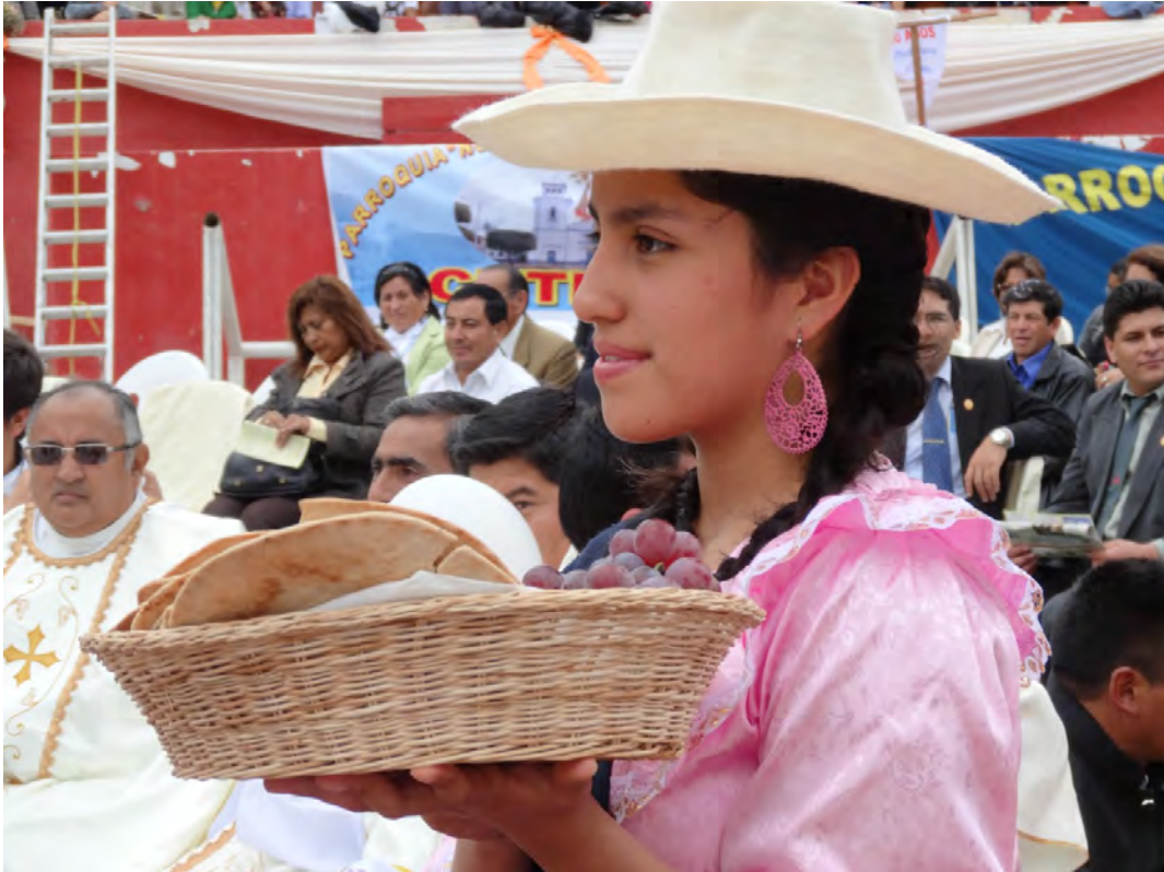
La persona crece, madura y es fecunda en la medida en que “se hace cargo” de la realidad sobre la que actúa y se compromete a “cargar” con ella.

La vida se acrecienta dándola y se debilita en el aislamiento y la comodidad. De hecho, los que más disfrutan de la vida son los que dejan la seguridad de la orilla y se apasionan en la misión de comunicar vida a los demás (EG 10).